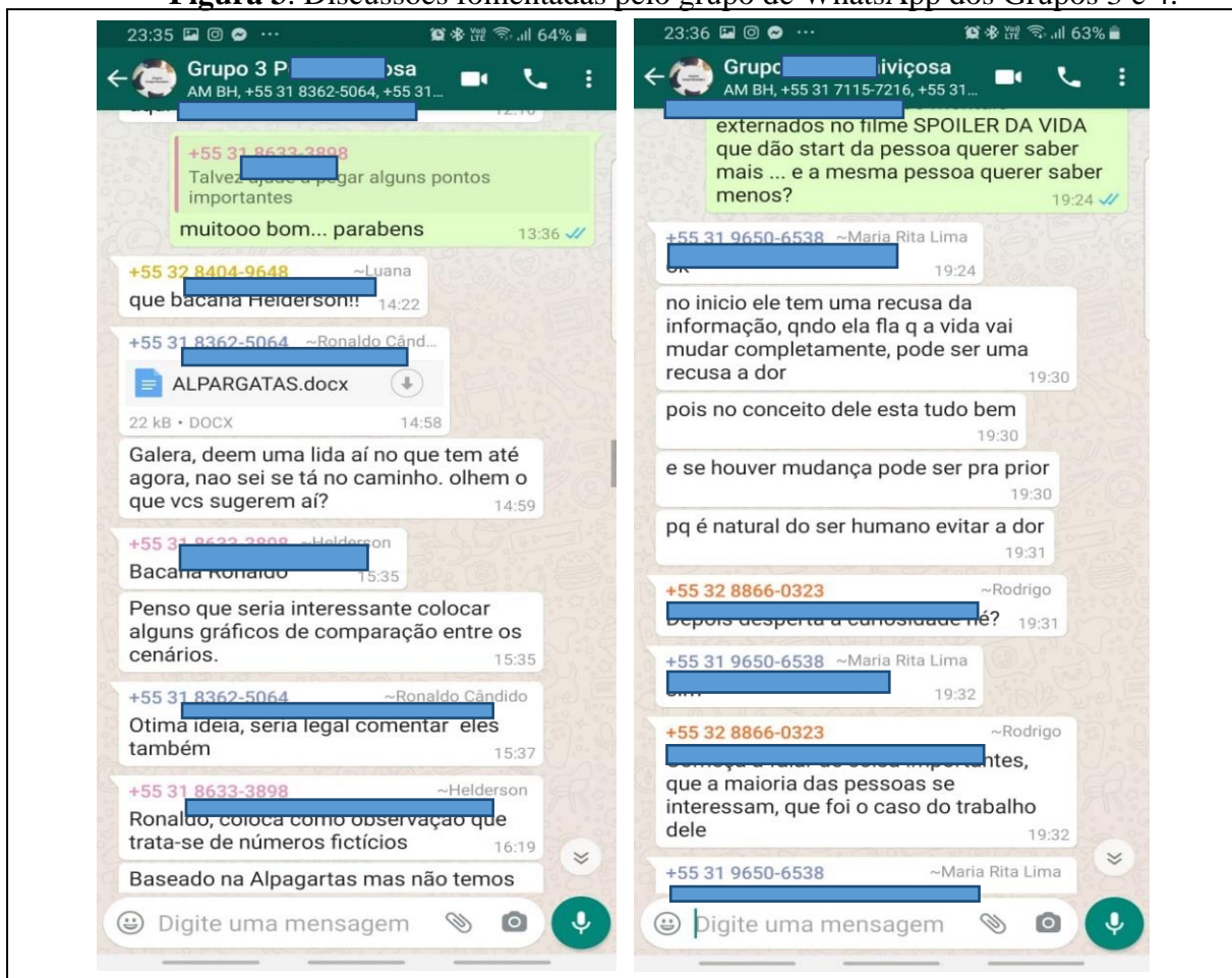
Figura 3. Discussões fomentadas pelo grupo de WhatsApp dos Grupos 3 e 4.